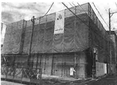
建設が進む新しい小倉昭和館