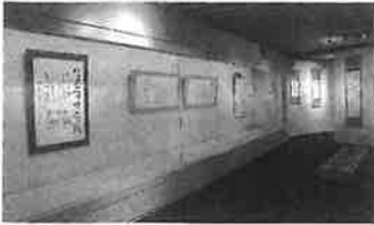
2023年5月に開催の「アメリカ文学 その広大さと多様さ」

その後、二〇一六年から北九州市立文学館との共催で毎年展覧会を開催している。江戸文学、古事記、北欧の神話と童話、アメリカ文学などを取り上げたが、なかでもシェイクスピアとの出会いは衝撃的であった。 二〇一八年、ロンドンでも「シェイクスピアを書く」展を開催したが、書を身にまとった彼は好感を持って受け入れられた。仮名の技法を持つ日本の書道は線で表されるアルファベットの表現も可能だ。多くの国の文学とも手を携えて、書を世界レベルのアートとしたい。書道の未来に不安を感じている私の切なる願いである。