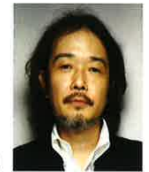
リリー・フランキー イラストレーター 作家・俳優など

「ノンフィクション」とは、身の回りでも本当であった話、あなた自身の体験談や取材した真実の話のことです。作品の主人公やテーマは自由です。