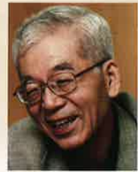
那須 正幹 児童文学作家