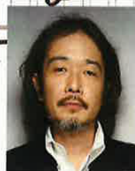
リリー・フランキー イラストレーター 作家・俳優など

「ノンフィクション」とは、身の回りでも本当であった話、あなた自身の体験談や取材した真実の話のことです。作品の主人公やテーマは自由です。