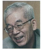
那須 正幹 (児童文学作家)