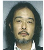
リリー・フランキー (イラストレーター、作家、俳優など)