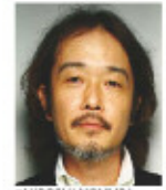
リリー・フランキー (イラストレーター、作家、俳優など)