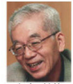
那須 正幹 (児童文学作家)