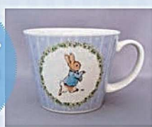
スープカップ(ストライプ)