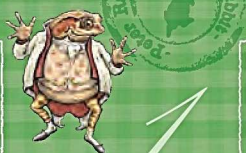
ビアトリクス・ポター 『THE TALE OF PETER RABBIT』 初版本(濃緑色版 F.WARNE & Co. 1902)