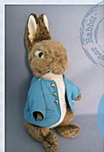
ピーターラビットぬいぐるみM

展覧会にあわせて可愛いピーターラビットのグッズを会場内で販売いたします。ぜひお手に取ってご覧ください。