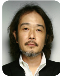
リリー・ فرانキー イラストレーター 作家・俳優など