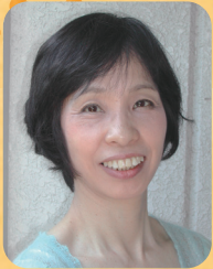
あさの あつこ 児童文学作家