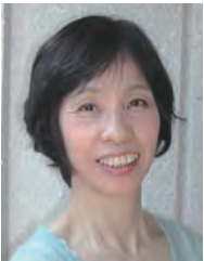
あさの あつこ 児童文学作家