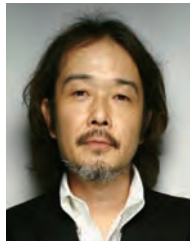
リリー・フランキー イラストレーター 作家・俳優など