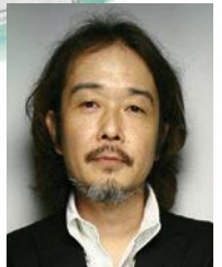
リリー・フランキー イラストレーター 作家・俳優など