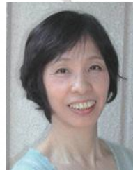
あさのあつこ 児童文学作家