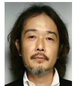
リリー・フランキー (イラストレーター、作家、俳優など)