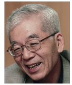
那須 正幹 (児童文学作家)